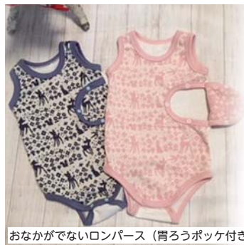
おなががでないロンパース (胃ろうポッケ付き)