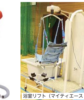
浴室リフト (マイティエースII)

抱っこによる介助は限界があります。様々な福祉用具を小さいうちから活用することがとても大切。ぜひ、体験してみてください！