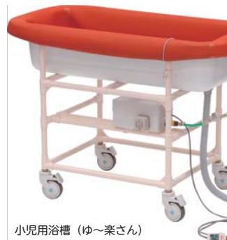
小児用浴槽 (ゆ〜楽さん)