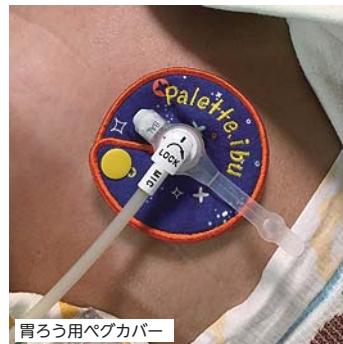
胃ろう用ペグカバー